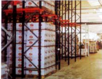
Rayonnage compact à palette