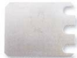
PLAQUE DE NIVELATION